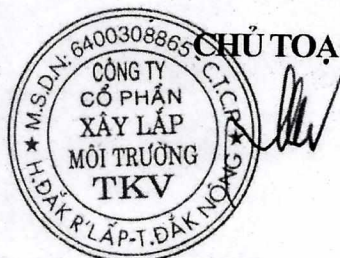
Lê Việt Quang

trước toàn thể Đại hội và được số cổ đông đại diện cho 100% số cổ phần có quyền biểu quyết có mặt tại Đại hội biểu quyết đồng ý thông qua./